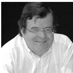
Composizione delle canzoni